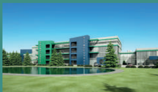
Научно-производственный комплекс по разработке и выпуску АФС «Фармославль» г. Ростов Великий