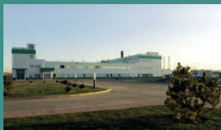
Завод по производству готовых лекарственных форм г. Ярославль