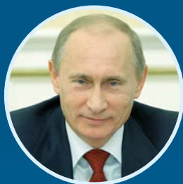
ПРЕЗИДЕНТ РОССИЙСКОЙ ФЕДЕРАЦИИ В.В. ПУТИН

... Отмечу плодотворную востребованную работу Общероссийской общественной организации «Лига здоровья нации». Её востребованные проекты и инициативы, направленные на развитие отечественной медицинской науки, продвижение ценностей здорового образа жизни в нашей стране, консолидацию профессионального сообщества вокруг единых целей и задач – заслуживают самого глубокого признания.