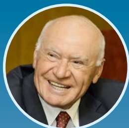
ПРЕЗИДЕНТ ОБЩЕРОССИЙСКОЙ ОБЩЕСТВЕННОЙ ОРГАНИЗАЦИИ «ЛИГА ЗДОРОВЬЯ НАЦИИ» АКАДЕМИК Л.А. БОКЕРИЯ

... Отмечу плодотворную востребованную работу Общероссийской общественной организации «Лига здоровья нации». Её востребованные проекты и инициативы, направленные на развитие отечественной медицинской науки, продвижение ценностей здорового образа жизни в нашей стране, консолидацию профессионального сообщества вокруг единых целей и задач – заслуживают самого глубокого признания.